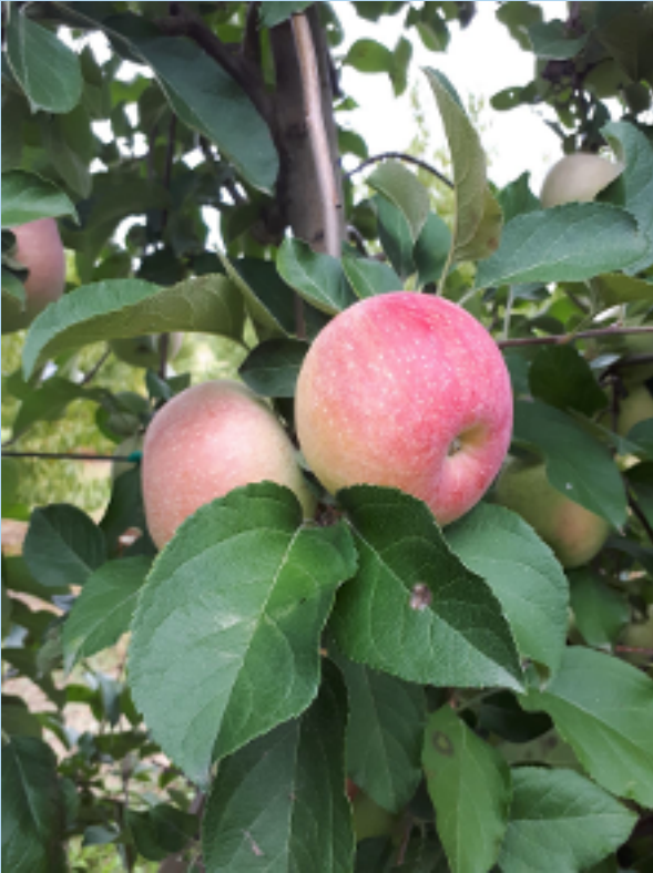
Εφαρμογή Cromaliv 250 ml/100L